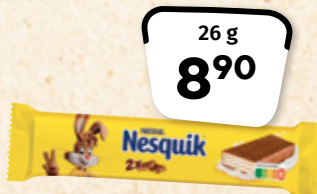
NESTLÉ Nesquik Wafer Milk Chocolate NESTLÉ ČESKO 100 g = 34,23