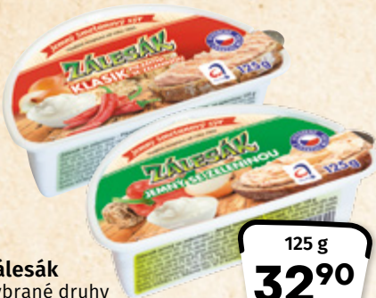
Zálesák vybrané druhy ALIMPEX FOOD 100 g = 26,32