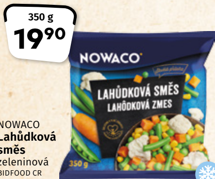
NOWACO Lahůdková směs zeleninová BIDFOOD CR 100 g = 5,69