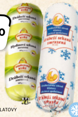
Drůbeží sekaná VODŇANSKÁ DRŮBEŽ, DRŮBEŽÁŘSKÝ ZÁVOD KLATOVY 1 kg = 79,80