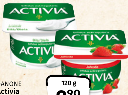
DANONE Activia vybrané druhy DANONE 100 g = 8,25