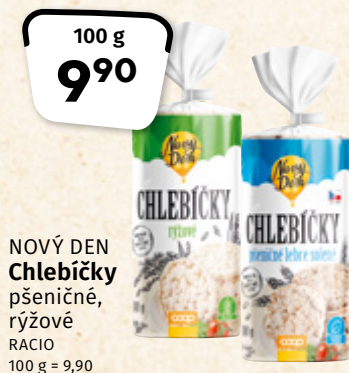
NOVÝ DEN Chlebičky pšeničné, rýžové RACIO 100 g = 9,90