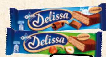
ORION Delissa vybrané druhy NESTLÉ ČESKO 100 g = 26,97