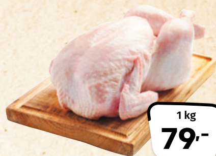
Kuře bez drobů VODŇANSKÁ DRŮBEŽ, DRŮBEŽÁŘSKÝ ZÁVOD KLATOVY 1 kg = 79,-