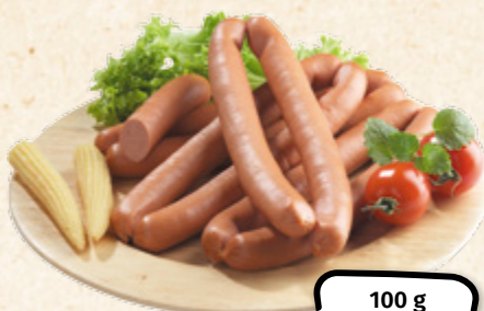
Vídeňské párky KRAHULÍK-MASOZÁVOD KRAHULČÍ, MASO UZENINY PÍSEK 1 kg = 169,-