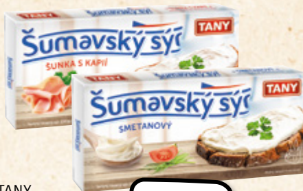
TANY Šumavský sýr vybrané druhy TANY NÝRSKO 100 g = 21,27