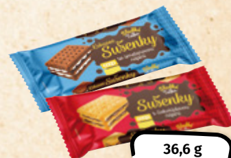
SLADKÁ TEČKA Sušenky s náplní smetanovou, čokoládovou ED. HAAS CZ 100 g = 16,12