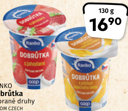
RANKO Dobruška vybrané druhy ACCOM CZECH 100 g = 13,-