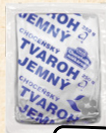
CHOCEŇSKÝ Tvaroh jemný ACCOM CZECH 100 g = 10,76