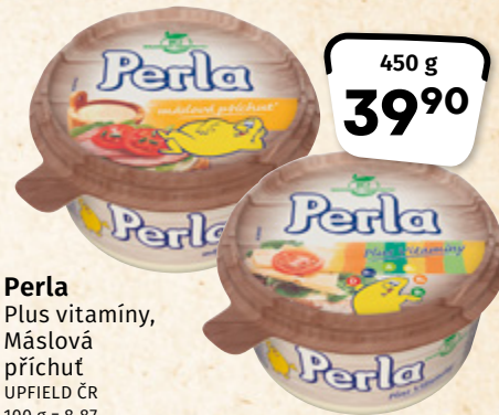
Perla Plus vitamíny, Máslová příchuť UPFIELD ČR 100 g = 8,87