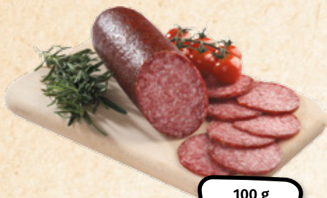
Turistický salám KRAHULÍK-MASOZÁVOD KRAHULČÍ, MASO UZENINY PÍSEK 1 kg = 209,-