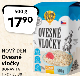
NOVÝ DEN Ovesné vločky BONAVITA 1 kg = 35,80