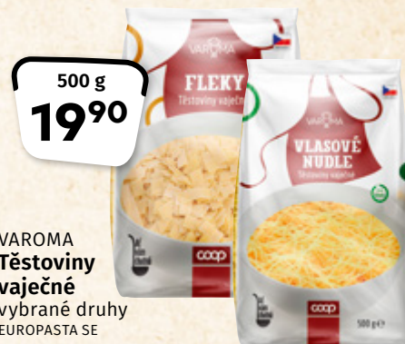
VAROMA Těstoviny vaječné vybrané druhy EUROPASTA SE 1 kg = 39,80