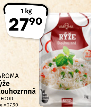
VAROMA Rýže dlouhozrnná LA FOOD 1 kg = 27,90