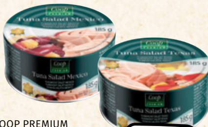
COOP PREMIUM Tuňákový salát Mexico, Texas PP ryby 55 g GASTON 100 g PP = 90,73