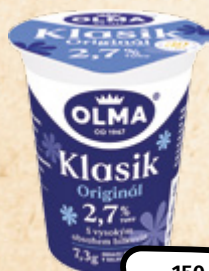
OLMA Klasik Original bílý jogurt OLMA 100 g = 5,93