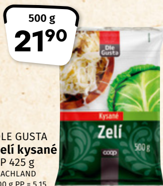
DLE GUSTA Zelí kysané PP 425 g MACHLAND 100 g PP = 5,15