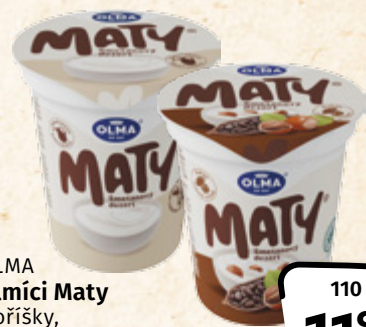
OLMA Olmíci Maty s oříšky, smetanový OLMA 100 g = 10,82