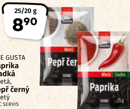
DLE GUSTA Paprika sladká mletá, Pepř černý mletý HTC SERVIS 100 g = 35,60/44,50