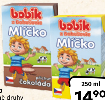
BOBÍK Mléčko vybrané druhy ACCOM CZECH 100 ml = 5,96