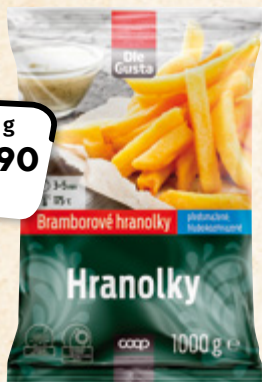
DLE GUSTA Hranolky CORNET CZ 1 kg = 49,90