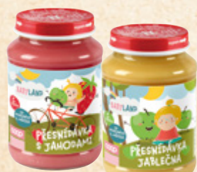
BABYLAND Přesnídávka vybrané druhy ORKLA FOODS 100 g = 9,95