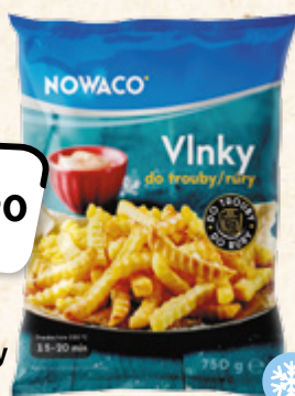
NOWACO Vlnky do trouby BIDFOOD CR 1 kg = 74,53