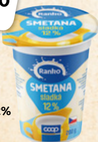
RANKO Smetana 12% sladká LACTALIS CZ 100 g = 7,45