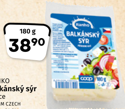
RANKO Balkánský sýr porce ACCOM CZECH 100 g = 21,61