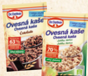
DR. OETKER Ovesná kaše vybrané druhy DR. OETKER 100 g = 22,24/23,89