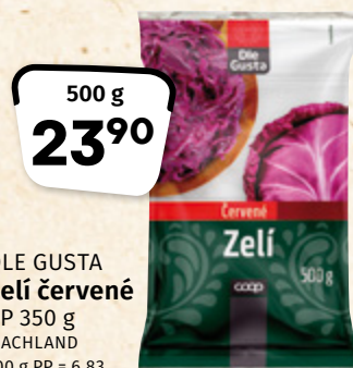
DLE GUSTA Zelí červené PP 350 g MACHLAND 100 g PP = 6,83