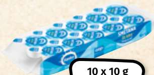
RANKO Smetana do kávy 10% ACCOM CZECH 100 g = 14,90