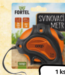
FORTEL Metr svinovací 5 m x 19 mm 1 ks = 59,90