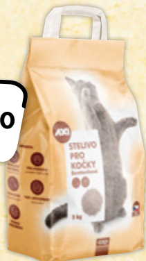
AXI Stelivo pro kočky hrudkující 1 kg = 9,98