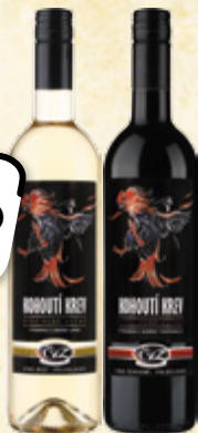
ČVZ Kohoutí krev víno polosladké, vybrané druhy 1 l = 106,53