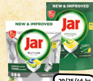
Jar vybrané druhy kapsle na nádobí 1 ks = 7,93/6,57/5,-