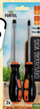
FORTEL Sada šroubováků 1 ks = 24,95