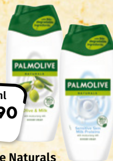
Palmolive Naturals Olive Milk, Milk Proteins sprchový gel 100 ml = 15,96