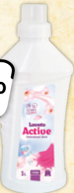
LAVATO Active odstraňovač skvrn 1 l = 44,90