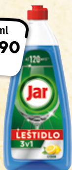
Jar leštidlo do myčky 100 ml = 27,75