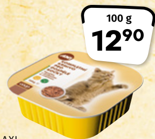
AXI Krmivo pro kočky Mozaika s kuřecím a zvěřivou 100 g = 12,90