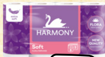
HARMONY Toaletní papír Soft Flora, 3vrstvý 1 ks = 7,49