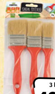
FORTEL Sada štětců 1 ks = 16,63