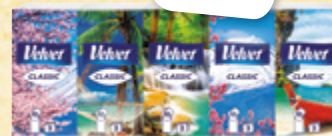
VELVET Papírové kapesníky Classic, 3vrstvé 1 ks = 2,39