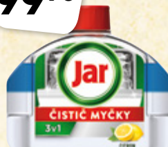
Jar 3v1 čistič myčky 100 ml = 39,96