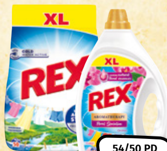
Rex vybrané druhy prací prostředek 1 ks = 4,63/5,-