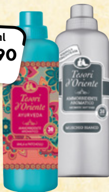
Tesori d'Oriente vybrané druhy 100 ml = 10,51