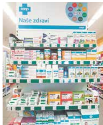
3. MÍSTO – stojan v Kamenném Újezdě

bez vytáček přiznali, že takový zájem o soutěž vůbec nečekali. Dorazilo totiž úžasných 99 fotografií, ze kterých se velice obtížně vybíralo.