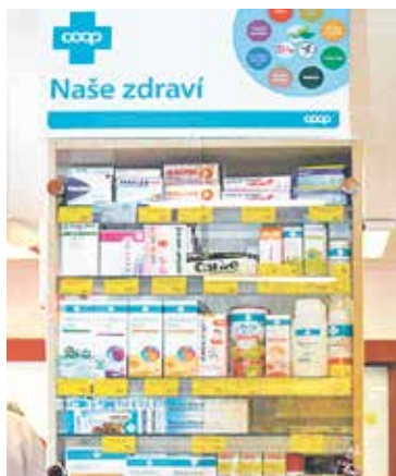
1. MÍSTO – stojan v Příbyslavi

99 prodejnám, které se do soutěže přihlásily, byl jako malé poděkování zaslán Batissept gel, rychleschnoucí dezinfekční gel na ruce.