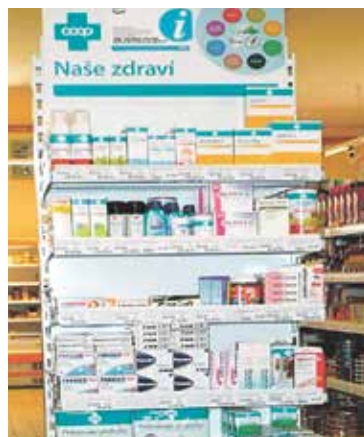
2. MÍSTO – stojan ve Volarech