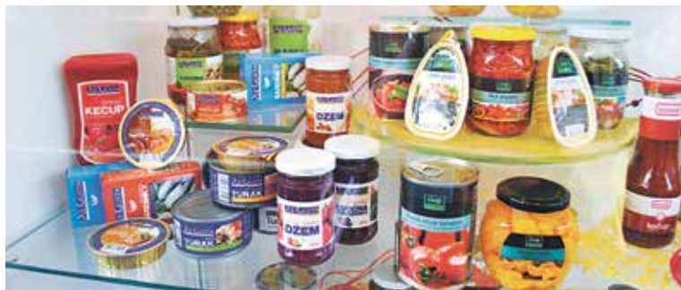
Privátní značky COOPu v expozici Hamé na veletrhu PLMA