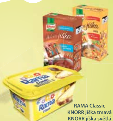
RAMA Classic KNORR jiška tmavá KNORR jiška světlá