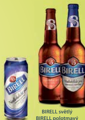
BIRELL světlý BIRELL polotmavý BIRELL světlý plechovka