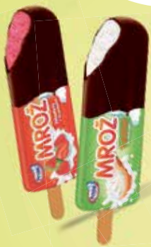
PRIMA Mrož jahodový PRIMA Mrož tvarohový