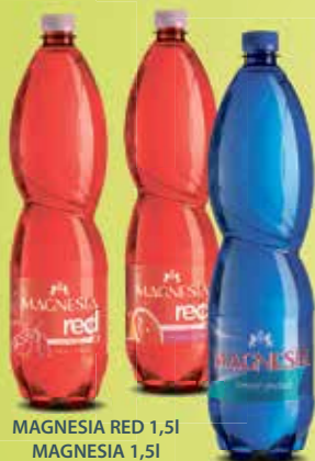
MAGNESIA RED 1,5l MAGNESIA 1,5l