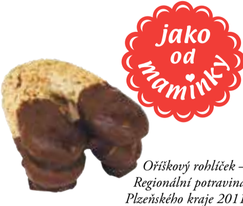
Oršíkový rohlíček – Regionální potravina Plzeňského kraje 2011

ZKD Sušice zajišťuje vlastní produkci cukrářských a lahůdkářských výrobků, které jsou na trhu známé pod značkou „jako od maminky“. Tyto výrobky ZKD