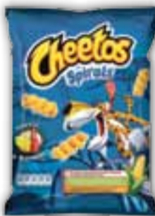
Spirály sýr a kečup