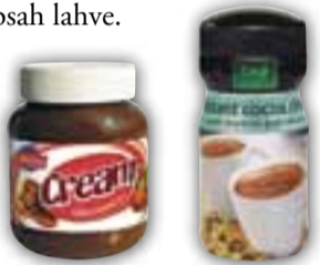
Z PET najdete nejen lahve

► POLYVINYLCHLORID – PVC – po polyetyleny nejužívanější plast. Jeho výroba je levná, snadno se zpracovává všemi možnými technologickými postupy, má výbornou tepelnou i chemickou odolnost. Při jeho výrobě však vzniká