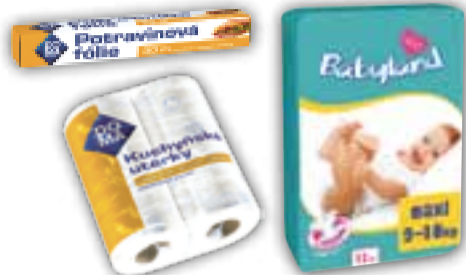
Příklady obalů z PE-LD – smršťovací fólie a měkké obaly výrobků

Polyetyleny jsou vysoce odolné vůči rozpouštědlům, ale s jejich tepelnou