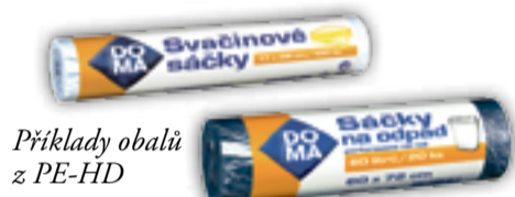
Příklady obalů z PE-HD

LDPE). Z vysokohustotního polyetyleny se vyrábějí např. dózy, plastová víčka, nádoby. Nízkohustotní polyetylen obohatil naše domácnosti o fólie či mikrotenové sáčky. Polyetyleny jsou využívány také ve stavebnictví a strojírenství. Potrubí, roury, ložiska, woodplastic prvky (prvky nahrazující dřevo) – tam všude polyetyleny nalezneme.