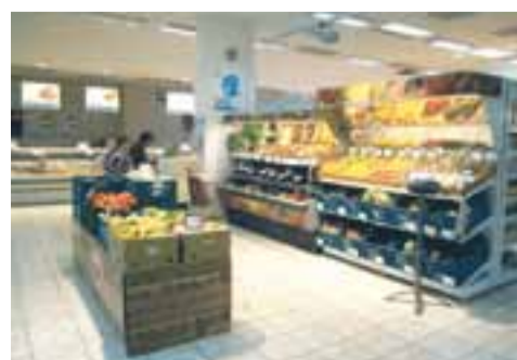
COOP TIP URAL, Sokolov

Protože ZKD Sušice je součástí skupiny COOP, proběhl v uplynulých letech na všech prodejnách z důvodu jednotné marketingové strategie značky COOP rebranding exteriérových prvků. V roce 2011 družstvo úspěšně začíná měnit také prvky in-store komunikace. Prodejna Ural v Sokolově se stává součástí pilotního projektu, jehož cílem je sjednotit také in-store identitu. Použité komunikační prvky jsou maximálně jednoduché, srozumitelné, univerzální a v neposlední řadě dobře odlišitelné od konkurence.