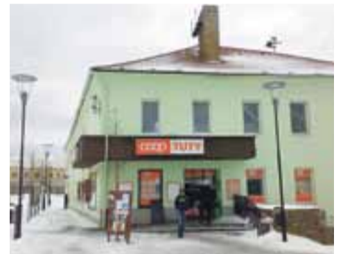
COOP TUTY KAŠPERSKÉ HORY

Hrad KAŠPERK byl založen roku 1356 českým králem a římským císařem Karlem IV. Úlohou byla ostraha zemské hranice se sousedním Bavorskem, ochrana zlatonosné oblasti a dále zajištění bezpečnosti Zlaté stezky, která spojovala Čechy se západní Evropou.