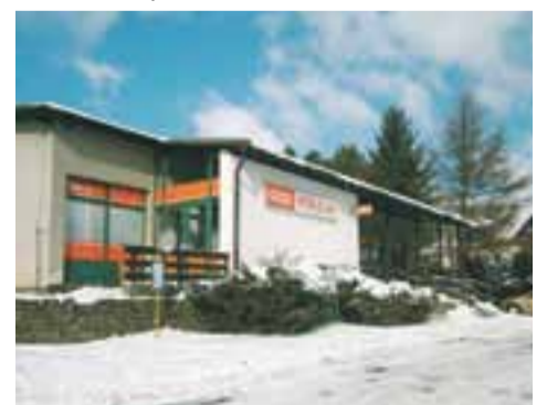
COOP KONZUM VELHARTICE