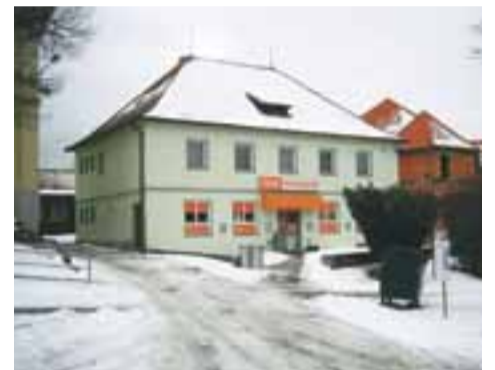
COOP KONZUM RABÍ

Hrad RABÍ je nejrozsáhlejší hradní zřícenina s jedním z nejvyspělejších obranných systémů v Evropě. Jádro hradu vzniklo patrně již na počátku 13. století v podobě strážní věže.