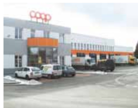
Řízený sklad ZKD Sušice

Druhým krokem, směřujícím k zajištění zásobování celého regionu, byla implementace Warehouse Management Systému. Ta proběhla v prosinci 2011 a lednu 2012 a spočívala ve vytvoření řízeného pozičního skladu. Celá logistika je nyní řízena elektronicky, počínaje nákupem zboží, přes jeho příjem do skladových lokací a konče zpracováním objednávek jednotlivých zákazníků a jejich vyskladením. Tento systém umožňuje on-line sledování skladových procesů, okamžitou kontrolu zásob a efektivní řízení činností zaměstnanců skladu. Dále umožnil bezproblémový přechod na dvousměnný provoz, který je nutností pro zajištění zásobování v rozsahu, jaký si celý region vyžaduje. Zároveň bylo možné zkrátit zákazníkům dobu od objednání po dodání o jeden den, což je pochopitelně velký benefit v současné tržní situaci.