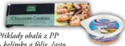
Příklady obalů z PP – kelímky a fólie, často v kombinaci s hliníkovou vrstvou

se z něj fólie, kelímky. Postupně nahrazuje PVC při izolaci kabelů, protože při vznícení neuvolňuje tolik škodlivin do ovzduší.