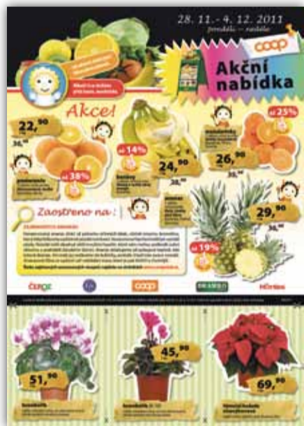
Sledujte naše letáky s akční nabídkou ovoce, zeleniny a květin

Řekne-li se poinsettie, zřejmě si málokdo ze čtenářů bude jist, o čem je řeč. Její zdomácnělé pojmenování už ovšem zná každý – vánoční hvězda. Variant, kterými si můžete ozdobit sváteční stůl, je široké množství – nejčastěji se na tuzemských pultech objevují rudě zbarvené květy, ovšem k vidění jsou také modrá, žlutá či bílá pouputa.